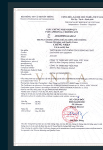
QCVN 117:2020/BTTTT AI CAM