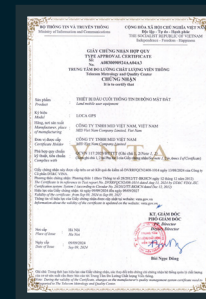
QCVN 117:2023/BTTTT LOCA GPS