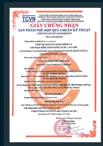
QCVN 06:2024/BCA AI CAMS