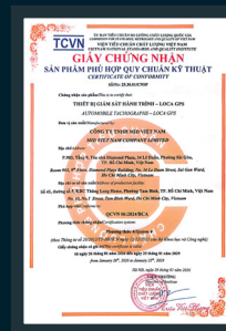
QCVN 06:2024/BCA LOCA GPS