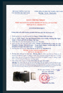
QCVN 31:2014/BGTVT AI CAM